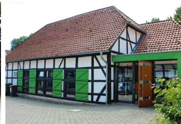
Nach dem Umbau

In den ehemaligen Stallungen ist heute unsere Kindergartengruppe zu Hause, während die frühere Scheune unseren Krippenkindern einen geschützten und warmen Raum zum Ankommen und Entdecken bietet.