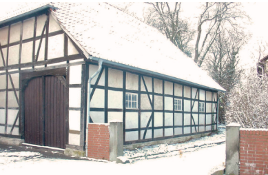
Die alte Scheune

Sicher fällt Ihnen bei einem Blick auf unsere KiTa sofort unsere besondere Umgebung ins Auge: Unsere Einrichtung befindet sich in zwei liebevoll sanierten, denkmalgeschützten Gebäuden.