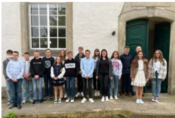
Die Konfirmandinnen und Konfirmanden aus Haimar, Rethmar, Dolgen und Evern

Weitere Impressionen von den Konfirmationen finden Sie auf www.kirche-sehnde.de/nachrichten/articles/konfirmation-2022.html