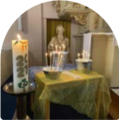
Friedensgebet am Freitagabend in der Kreuzkirche Sehnde

In unserer Kirchengemeinde gibt es viele Menschen, die Mitglied in der Kirche sind, aber sehr selten oder sogar nie in den Gottesdienst gehen. Sie sagen: „Ich bin ja eher nicht so der Kirchgänger...“ Den Sonntagvormittag verbringen viele mittlerweile in der Familie, beim Sport oder sind unterwegs. Und das ist auch in Ordnung so. Es entspricht einer kulturellen Prägung in unserem Landstrich und einer allgemeinen Entwicklung in unserer Gesellschaft.