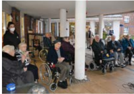
Gottesdienst in der AWO-Residenz in Sehnde

Gott spricht: Ja, ich will euch tragen bis ins Alter und bis ihr grau werdet. (Jesaja 46,4)