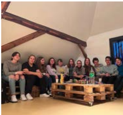
Der neugestaltete Jugendraum in Rethmar

Am 18. Juni 2022 zwischen 14-17Uhr laden wir Kinder und Jugendliche, gern aber auch ganze Familien ein, unseren Jugendraum zu besuchen. Wir werden zusammen auf der Kirchwiese grillen und Getränke anbieten, klönen und Spiele machen. Herzlich willkommen!