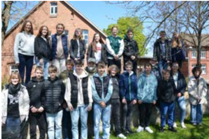
Die Konfirmandinnen und Konfirmanden aus Sehnde

Mit festlichen Gottesdiensten haben wir am 30. April in Haimar, am 1. Mai in Rethmar und am 14. und 15. Mai in Sehnde Konfirmation gefeiert. Wir gratulieren unseren jungen Kirchenmitgliedern von Herzen und wünschen ihnen Gottes Segen für ihren weiteren Weg!